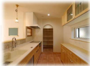
【おしゃれなキッチン】