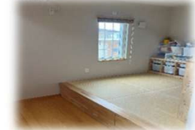
【小上がりの畳コーナー(収納付)】