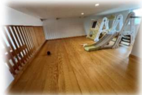
【13畳の小屋裏 ロフト】