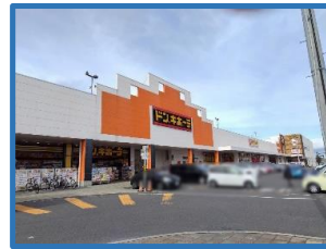
・ドン・キホーテ郡山駅前東店 1.1km