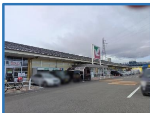
・ヨークベニマル横塚店 約1.4km